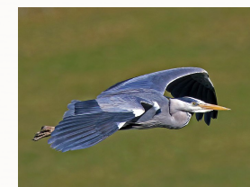
Héron cendré en vol de Charles J. Sharp (Wikicommon)

Aucun prédateur, bonnes relations avec l'humain Convention de Bonn, accord AEWA Convention de Berne, annexe III Arrêté du 29 octobre 2009 fixant la liste des oiseaux protégés sur l'ensemble du territoire et les modalités de leur protection, article 3 Classement UICN : préoccupation mineure (LC)