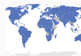
Pays signataires de la Convention de Berne