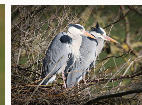
Couple de hérons cendrés de Collnsmart (Pixabay)