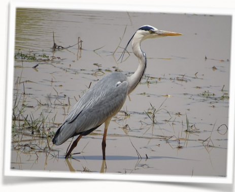
Héron cendré de Farid Amadou Bahleman (Wikicommon)