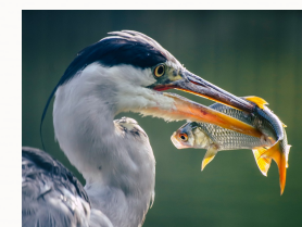
Repas d'un héron cendré de Wa_172619 (Pixabay)