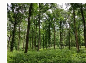
Forêt communale de Brion de Jean-Baptiste Belloc