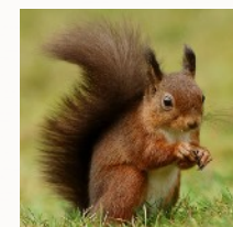
Écureuil roux de Peter.G Trimming