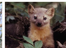
Martre des pins - Martes martes