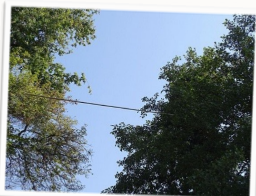
Écuroduc - passage sécurisé pour écureuils.

Ordre des Rodentia , famille des Sciuridae . Petit mammifère diurne, rongeur, haut d'une vingtaine de centimètre environ, il arbore une queue panachée de 14 à 20cm de long qui lui sert de balancier et d'objet d'expressions. Son pelage varie du jaune au brun très foncé, mais reste globalement roux avec un ventre blanc. Il est doté de 2 petits yeux noirs latéraux et saillants, 22 dents sans canine, 2 oreilles pointues munies de « pinceaux » durant l'hiver, des vibrisses sur le museau, sous le menton et le corps, à la base de la queue et autour des yeux. Il pèse environ 300g et peut se propulser sur environ 5m grâce à de puissantes pattes postérieures à 5 doigts. Avec ses pattes antérieures à 4 doigts, il saisit champignons, fruits, graines, lichen, petits oiseaux, oeufs, insectes et escargots... pour se sustenter.