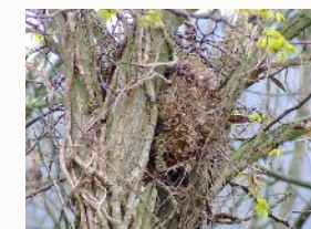
Nid d'écureuil roux de Mathieu Giraudeau